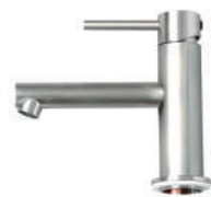
ストレート混合栓 サテン