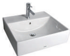
スクエア洗面器 ハイライズ (壁付金物付属)