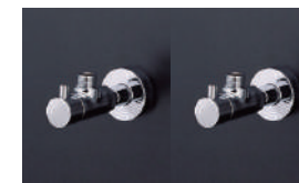
混合栓用止水栓 壁給水タイプ (2個セット)