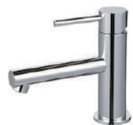
ストレート混合栓 クローム