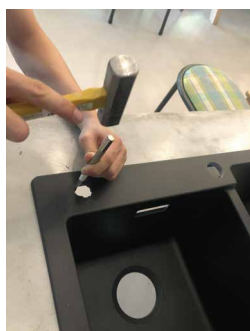
ポンチとハンマーで