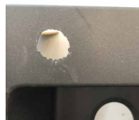
丸くなってきた様子