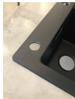
どこまできれいに削るか悩みますが、ほどほどで